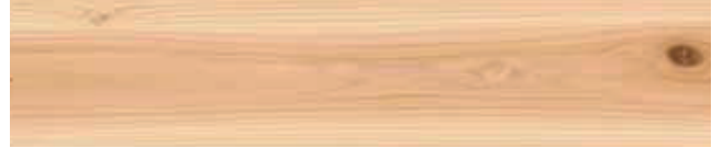
とぎだし加工（表面）